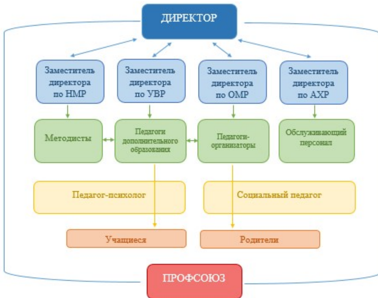
Рисунок 2 – Структура МБОУ ДО ЦТ «Содружество»

Укомплектованность кадрами в 2022 году составило 100%.