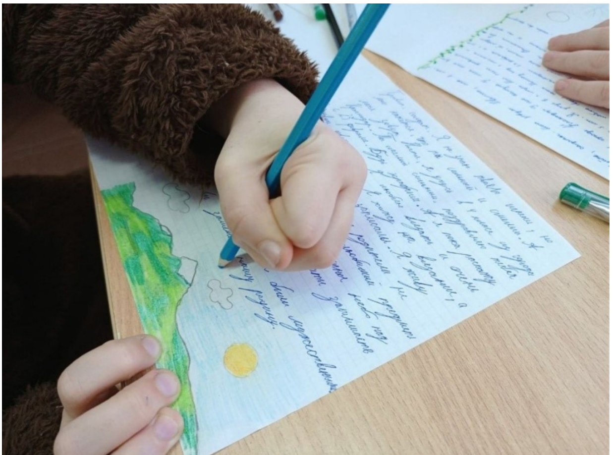
Подготовка открыток с теплыми пожеланиями.