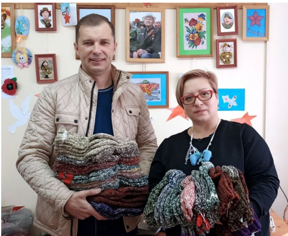
Сбор гуманитарной помощи в клубах по месту жительства.