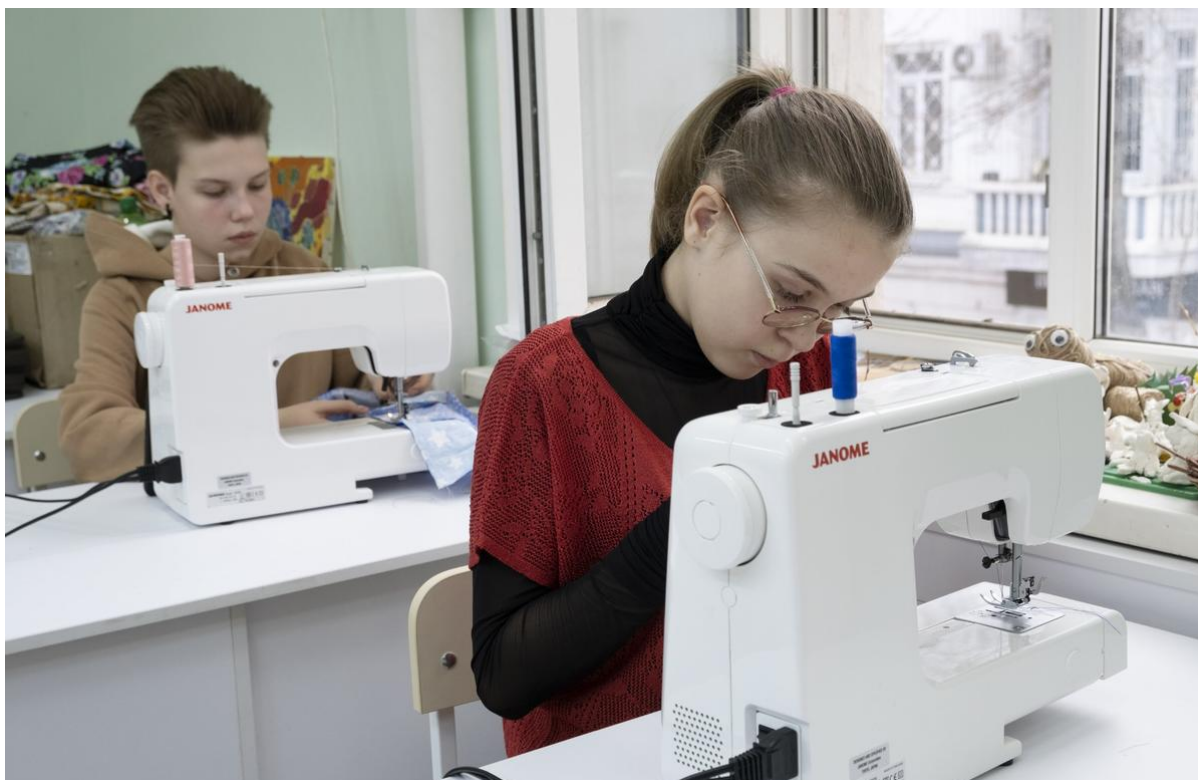
Пошив одежды на занятиях.