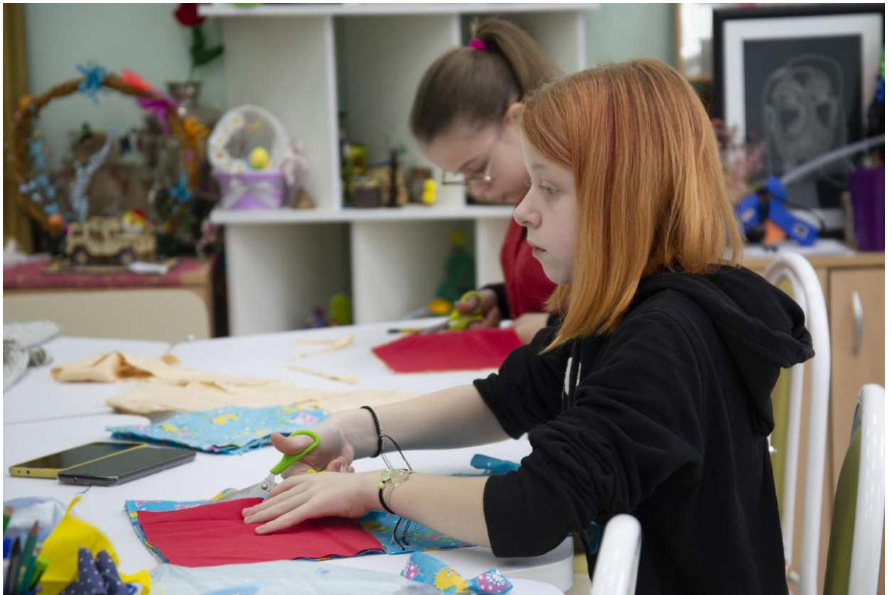
Пошив одеял на занятиях.